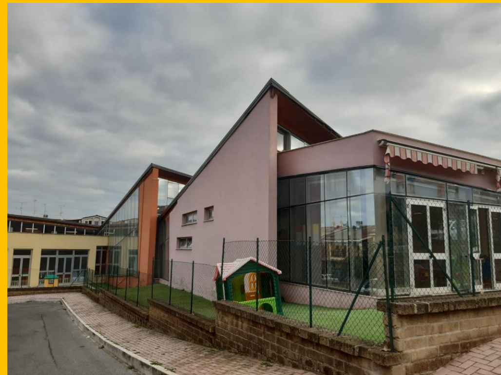
Via Giacomo Balla, 21